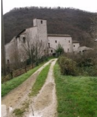
Via di accesso all'Abbazia