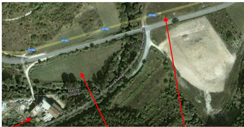
Abbazia di Sant'Emiliano e Bartolomeo in Congiuntoli